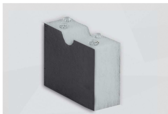
F700 FR HO HT