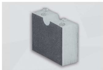
F700 FR HO/53